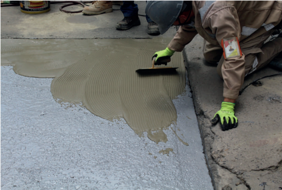
Figura C. Extensión del mortero de reparación