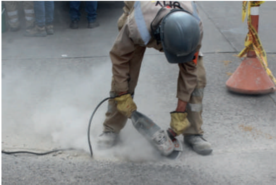
Figura 2: Herramienta de corte