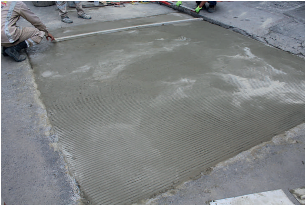
Figura d. Acabado del mortero de reparación