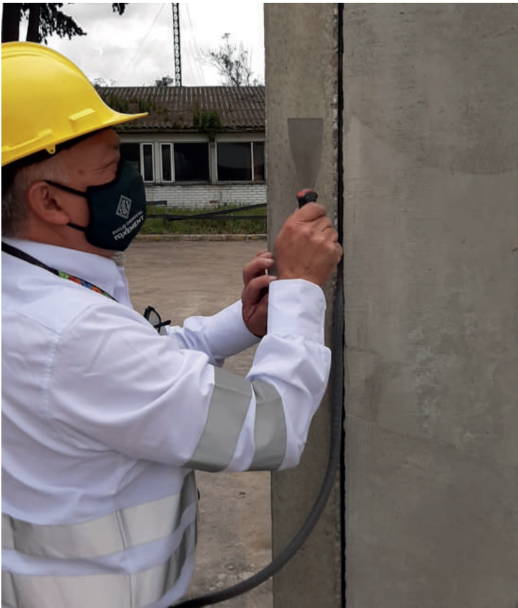
Figura 3. Colocación del cordón de respaldo SELLASIL SOPORTE