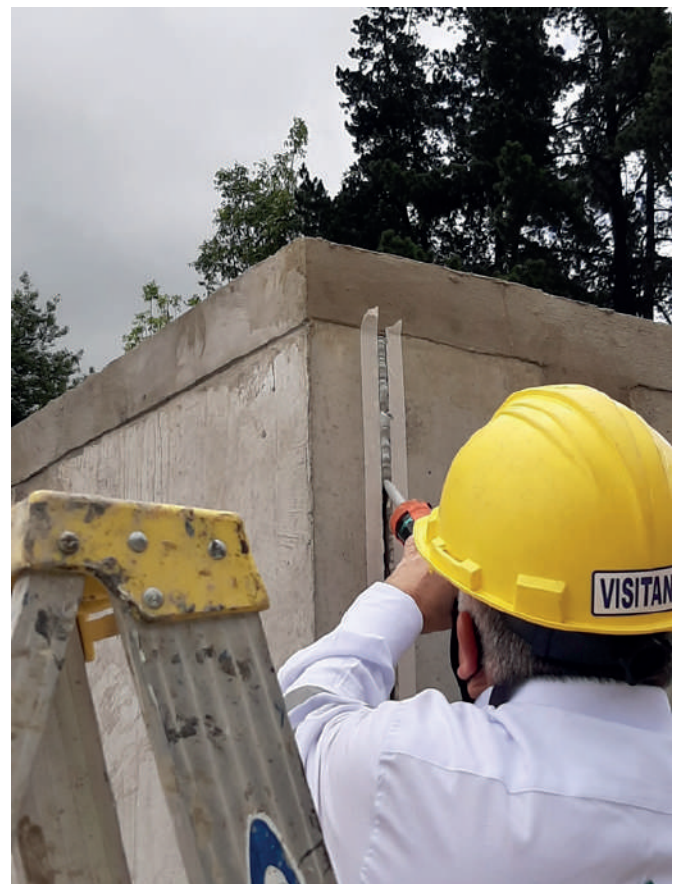
Figura 4. Colocación sello de juntas