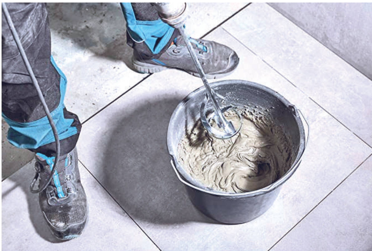
Figura 1. Herramientas de mezclado